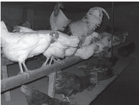
Hühnerstall von Fredy Schmied

Zum Beispiel bei der Hühnerhaltung geht es u.a. darum was mit den männlichen Kücken geschieht (heute werden diese nach dem Schlüpfen eingeschläfert). Oder ob die Tiere während dem „Mausen“ eingeschläfert werden sollen, weil sie keine Eier legen oder ob die Hühner weiter leben und danach erneut, aber weniger Eier legen. Oder wie alt die Hühner werden sollen oder ob alte Hühner geschlachtet und als Suppenhühner zubereitet oder in der Kadaversammelstelle entsorgt werden sollen? Welche Haltungsintensität wird gewünscht. Soll der Tag während der Wintersaison durch künstliches Licht verlängert und damit die Produktion erhöht werden etc.?